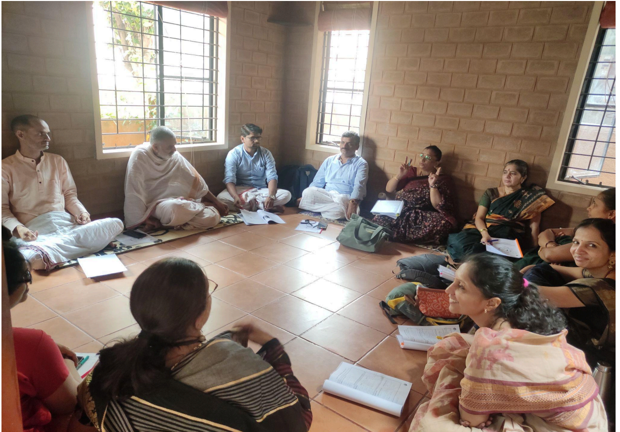
ಪ್ರಶಿಕ್ಷಣ ತಂಡದ ಸದಸ್ಯರಿಗೆ ಸ್ವ-ಕಲಿಕಾ ವಿಧಾನದ ಕಾರ್ಯಾಗಾರ (ಅಸಲಿ ಶಿಕ್ಷಾ)