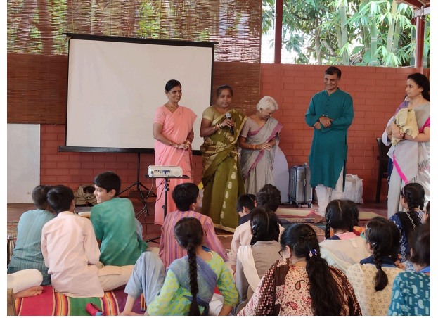
ಭಾರತೀಯ ಕ್ರಮದಲ್ಲಿ ಸೂಕ್ಷ್ಮವಾಗಿ ದಾರ ತೆಗೆಯುವ ಕ್ರಮ ವಿದ್ಯಾಕ್ಷೇತ್ರ - ಕಾರ್ಯಾಗಾರ