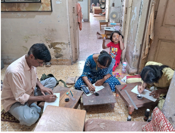
ಪೂರ್ಣಪ್ರಮತಿ ಚಿತ್ರಕಲಾವಿದರು ಹಸ್ತಲೇಖನ ಕಾರ್ಯಾಗಾರ (ಅಹಮದಾಬಾದ್)