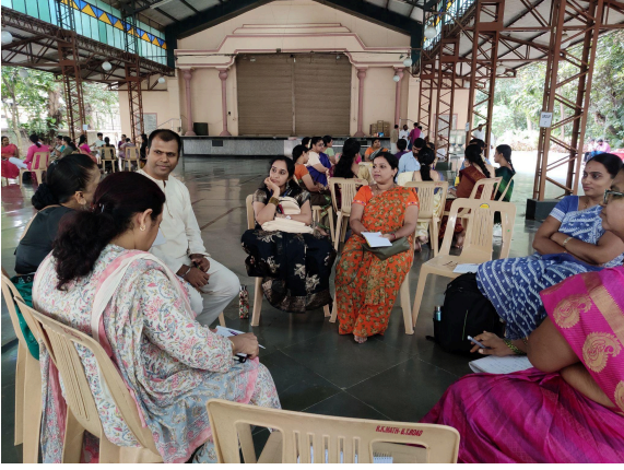
ಗುಂಪು ಚರ್ಚೆ - ರಾಮಕೃಷ್ಣ ಆಶ್ರಮ