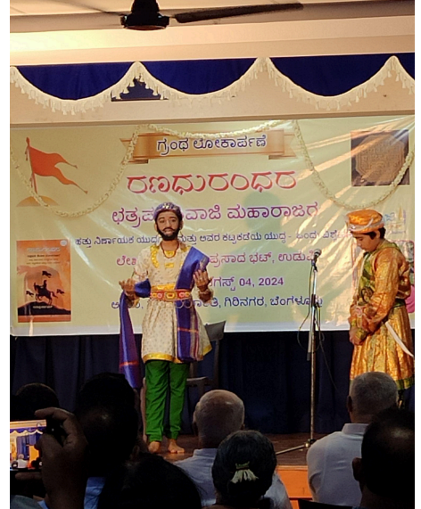
ಕೆಲವೇ ದಿನಗಳಲ್ಲಿ ಸಿದ್ಧವಾದ ಸಂಸ್ಕೃತ ನಾಟಕ (ಛತ್ರಪತಿ ಶಿವಾಜಿ) ಪುಸ್ತಕ ಬಿಡುಗಡೆ ಕಾರ್ಯಕ್ರಮ - ಅಕ್ಷರಂ