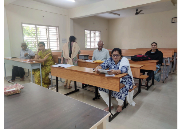
ವಿಭಕ್ತಿ-ಪ್ರತ್ಯಯ ಕಾರ್ಯಾಗಾರ - ಅಕ್ಷರಂ (ಪ್ರಶಿಕ್ಷಣಾರ್ಥಿಗಳು)